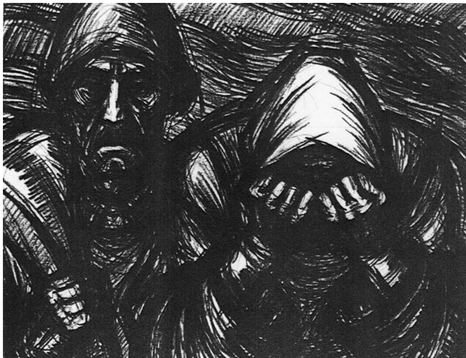
Ülj törvényt, Werbőczy! II.