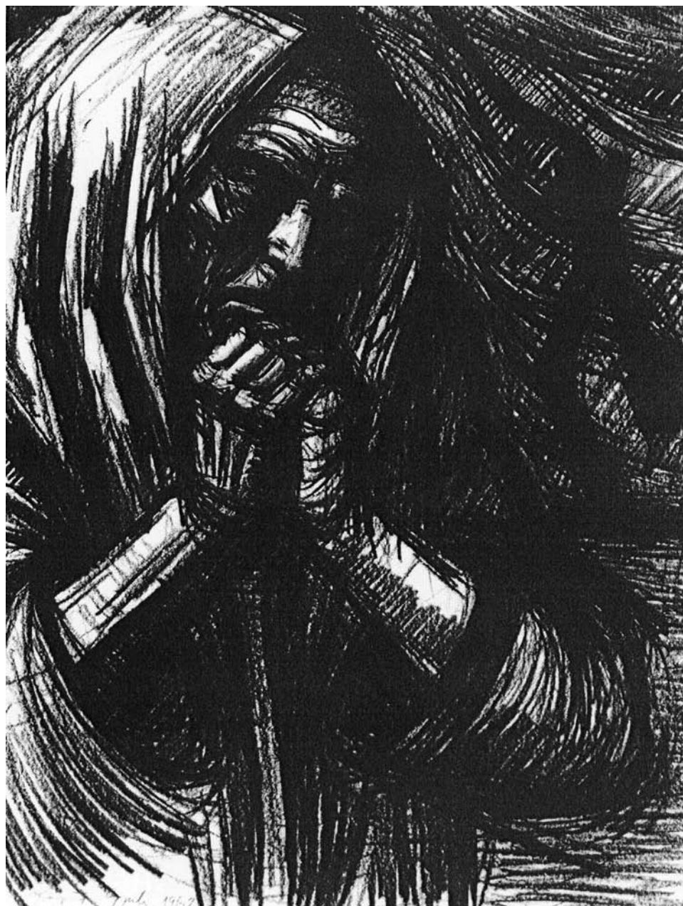
Ülj törvényt, Werbőczy! I.