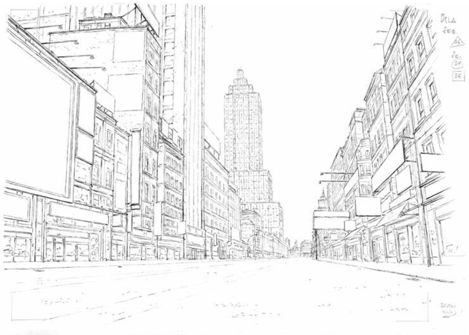
Háttér layout, Tóth Roland