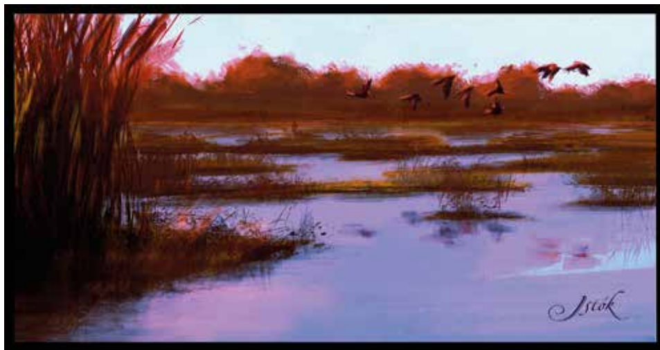
Látványterv, Szabó Alex