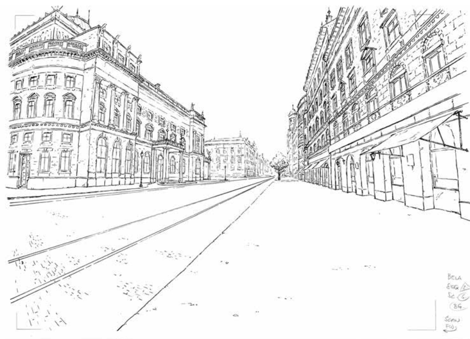
Háttér layout, Tóth Roland