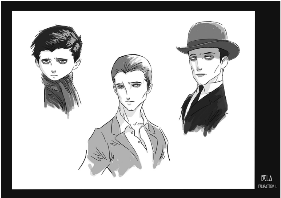
Karakterdizájnok, Tóth Roland