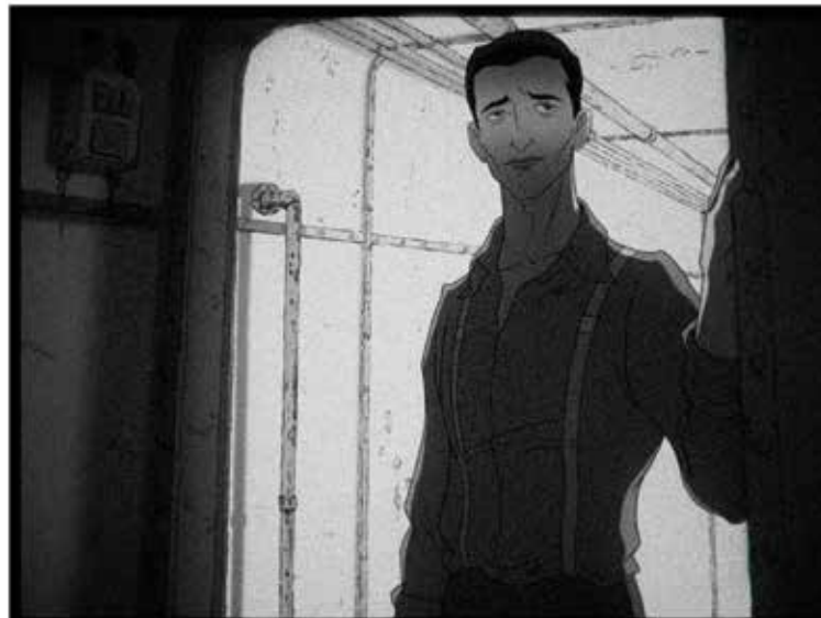
Storyboard kép; látványterv kép, Tóth Roland és Rittgasser István; végleges filmkép