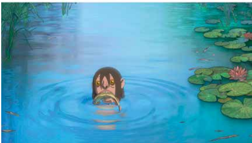
Storyboard kép, Tóth Roland; Color script kép, Szabó Alex; végleges filmkép